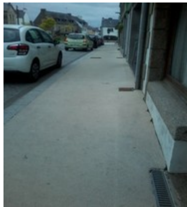
Trottoir rue principale