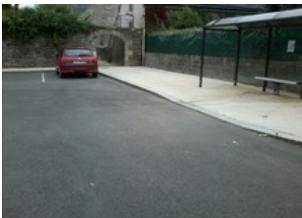
parking devant l'abri bus

au blanc de meudon, écriture de poèmes ou bouts de poèmes au sol (et sur des vitrines ?) par l'artiste séverine valomet (avec du public éventuellement)