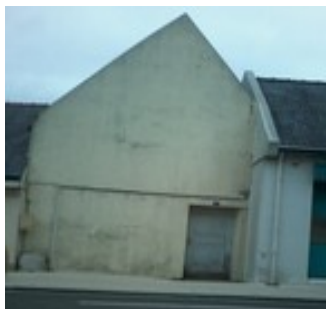
Dans la Rue principale