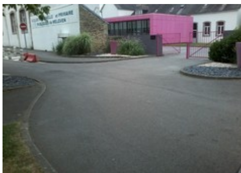
devant l'école primaire