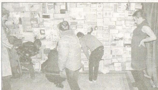
Mardi dernier, les spectateurs se pressaient dans le décor de la cité des 4.000 souliers.

La Quincail'Cie, de Poullaouen, a envahi le quartier de Bois-du-Château durant toute la semaine, pour le Printemps des Poètes. Ce matin, elle propose de découvrir son spectacle « La cité des 4.000 souliers », une proposition très fine, une évocation sensible et légère de personnages à peine esquissés. Comme le portrait en creux des habitants d'un immeuble, à la façon de « La vie mode d'emploi » de Perec, les filles de la Quincail' dessinent des destins avec des boîtes, des chaussures et beaucoup de poésie, comme un tableau plein de petites touches. Tissus écossais, boucles