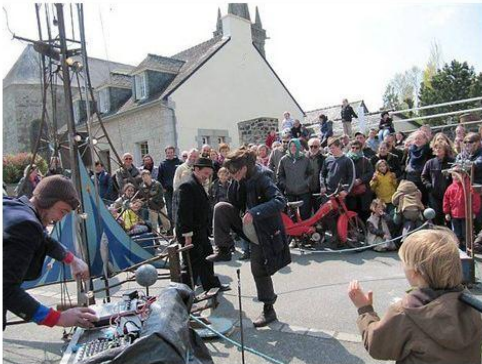
Surprenante L'attraction terrestre de la Cie El Kerfi !